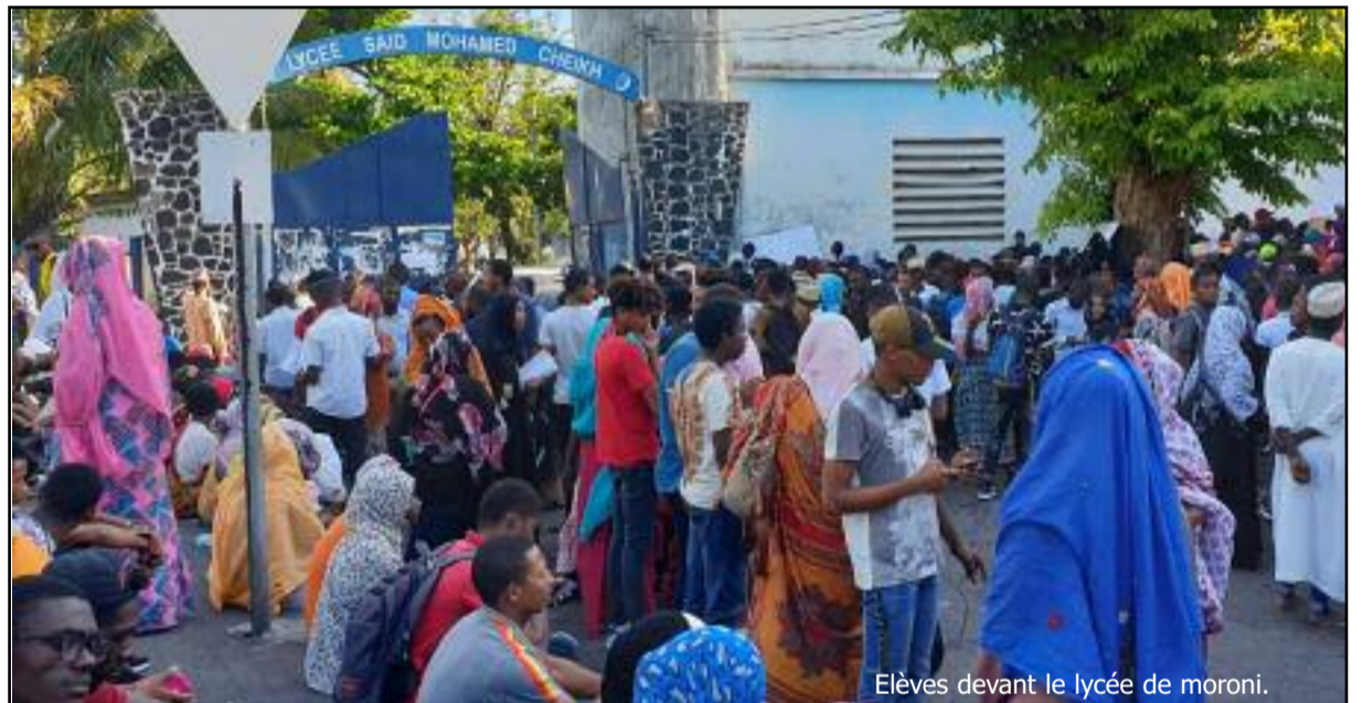
Elèves devant le lycée de moroni.